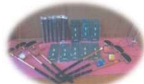
グラウンドゴルフ備品