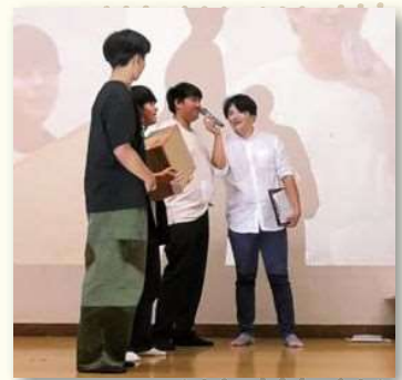
初代チャンピオン 中学生代表チーム

また、エキシビジョンマッチでは、オムロンピンディーズ（ハンドボール）VS 熊本ルネサンスFC（サッカー）による異種格闘技戦が行われました。