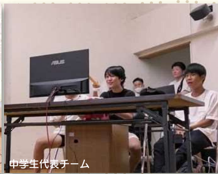
中学生代表チーム