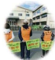
見守り活動用ベスト