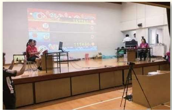
オムロンピンディーズ VS 熊本ルネサンスFC

大会開催後、選手や観客からは「もっと練習してリベンジしたい」「来年は必ず出場します」「eスポーツの普及につながる良い大会だった」といった声が寄せられました。また、大会を主催した日吉東校区自治協議会からは「来年も開催して、住民の皆様喜んでいただけるような祭りにしたい」とのコメントが寄せられました。