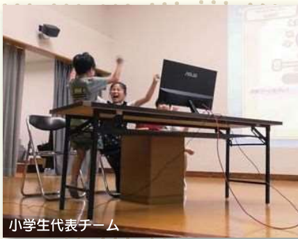
小学生代表チーム

決勝戦は小学生代表チーム VS 中学生代表チームで行われ、激戦の末に中学生代表チームが栄えある初代チャンピオンに輝きました。