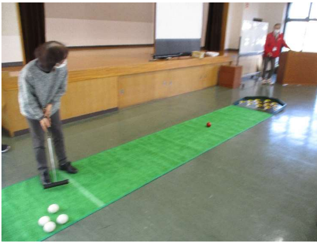
レクリエーション体験(スカットボール)