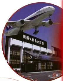
あそ熊本空港 (益城町)