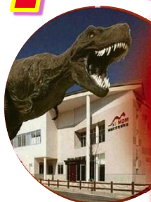
恐竜博物館 (御船町)